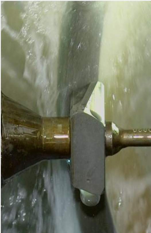
Affûteuses pour plaques amovibles et logiciel