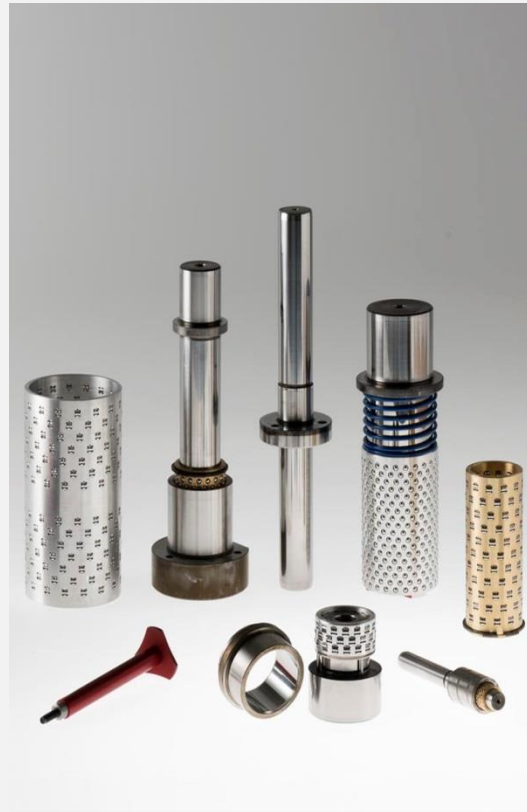
Pièces normalisées pour moules d'outils et construction de machines