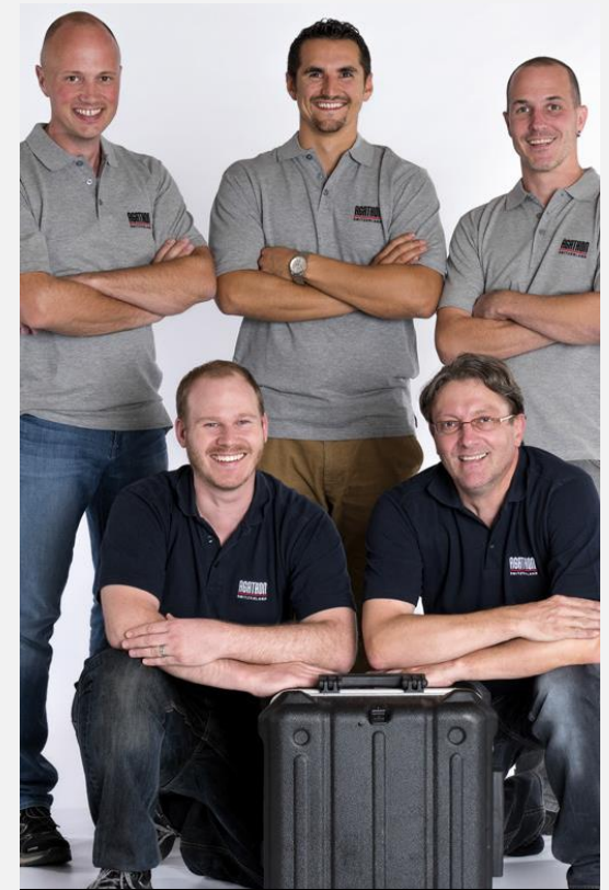
Support et service